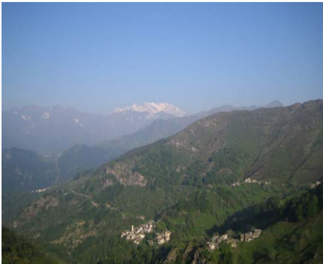
Rimella - Monte Rosa