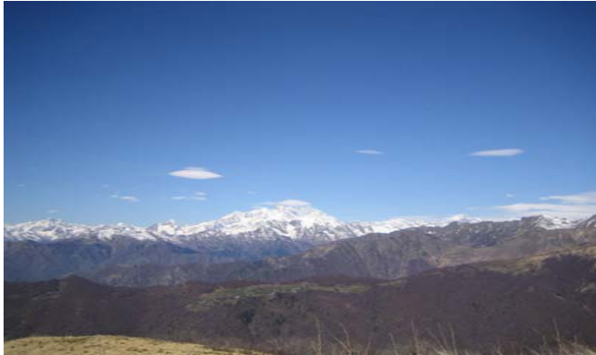
Cima del Camossaro → Monte Rosa

Nette Kleinstadt im wilden und unbekanntem Sesiatal. Idealer Stützpunkt für herrliche Bergwanderungen und schöne Aussichtsgipfel. Für Abenteurer und Genießer!