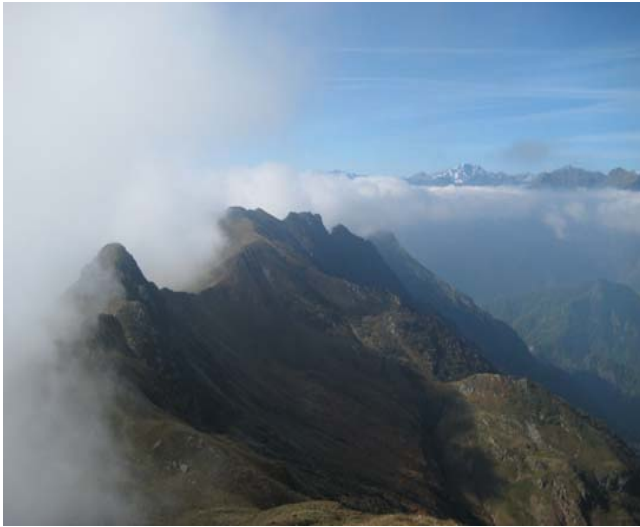
Cima Cevia - Kaval - Corno Bianco