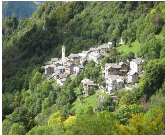
Rimella, Ortsteil San Gottardo

Idee · Fotos · Texte · Realisation · Web-Design Jörg Klingenuß · info@rimella.de