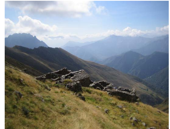
Alpe Pianaronda → Sesiatal